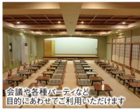
会議や各種パーティなど目的にあわせてご利用いただけます